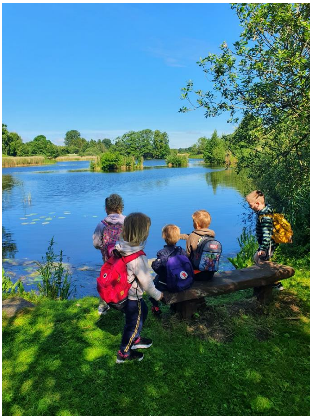
GØRSLEV BØRNEHUS – et Reggio Emilia inspireret dagtilbud